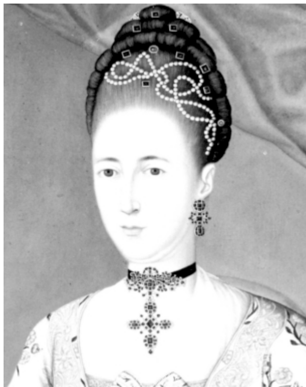
Joaquín Gutiérrez, "Marquessa de San Jorge", 1775, óleo/tela, 145 x 105 cm (detalle). Museo de Arte Colonial.

El intercambio de flujos informativos en la Red tiene lugar fundamentalmente a través de las páginas