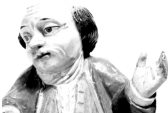
Personaje popular. Talla en madera policromada, 20 cm de altura, c. 1770 (detalle). Museo de Arte Colonial.

[...] partimos justamente de esta idea de que vivimos en un capitalismo semiótico plagado de sentidos, significaciones, imágenes, digamos con sentidos específicos y orientadas en un