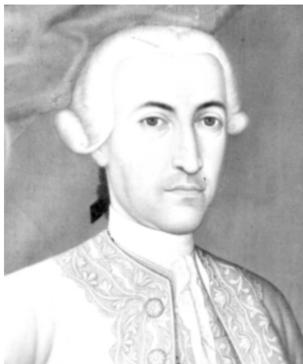
Joaquín Gutiérrez, "Marqués de San Jorge", 1775, óleo/tela, 145 x 106 cm (detalle). Museo de Arte Colonial. Archivo fotográfico del ICC, 1975.

En la vida cotidiana los medios electrónicos, la fotografía en la prensa escrita, el cine o la televisión generan imágenes como parte de sus actividades propias de producción, recepción y distribución que operan como formas de acción social. Estas formas de acción social, con fines de protesta y denuncia, son desplegadas